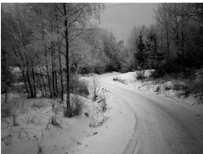
Tjocköväg – vacker även på vinter. Men många kommer inte att kunna ta sig ned till bryggan för att hämta sin post!