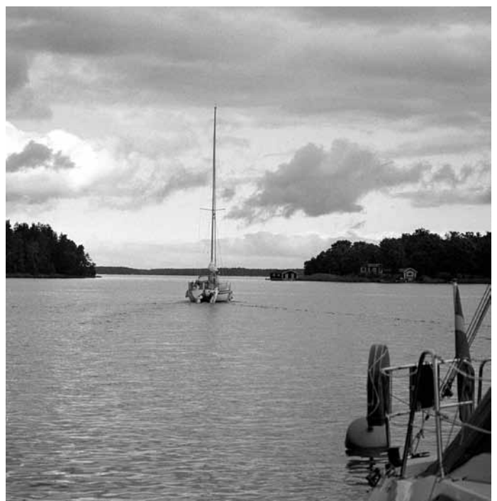
På nordlig kurs från den populära gästhamnen

Missionshuset i Gräddö är idag det enda aktiva bönhuset på Rådmanö. Här fanns i princip ett bönhus i varje by. Alla utom detta har blivit privatiserade. Det var olika samfund, men Missionsförbundet var dock det största. Dit har nu även de kvarvarande resterna av de andra samfundens samlats.