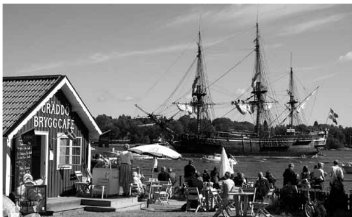
Bilden på Götheborg är från dess första besök i Norrtälje.