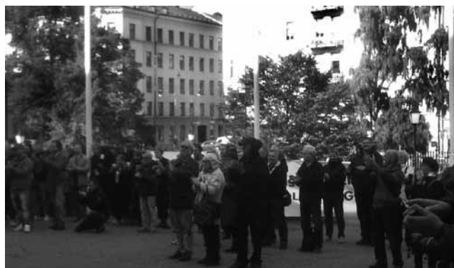
Manifestationen mot sjötrafikupphandlingen 23 september utanför landstingshuset på Hantverkargatan i Stockholm

Så vad händer nu? Ett Sjötrafikråd är på tapeten. Till sist! Riktigt hur detta ska utformas är det väl ingen som riktigt vet än men skärgårdens organisationer lär få en oerhört