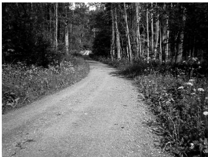
Vacker Tjocköväg sommar