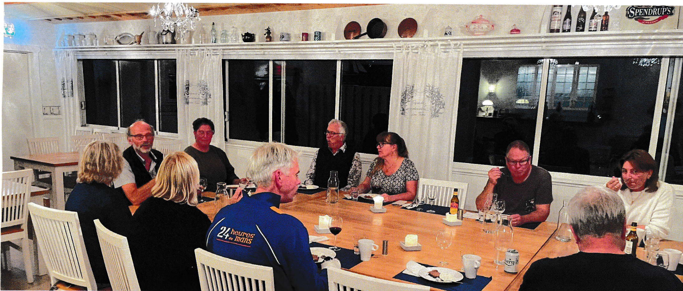
Styrelsemöten behöver inte vara stela och tråkiga. Här möts BSFS på Ökrogen på Tjockö 2021.