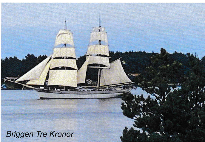
Briggen Tre Kronor

Avser verksamhetsår 1 okt 2023 – 30 sept 2024