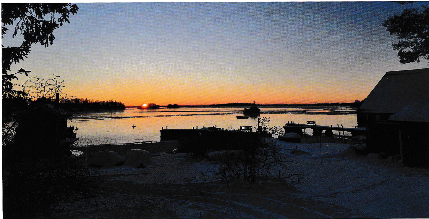
Att komma hem efter jobbet är bättre vissa dagar än andra.