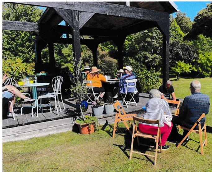
En fikastund efter båttresan smakade fint.