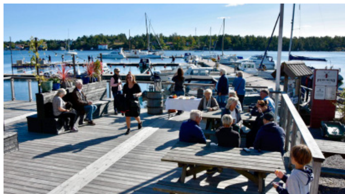
Invgivningsfika på bryggan.