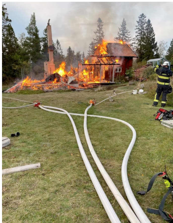
Huset på Söderöra var övertänt när branden upptäcktes och brann ner till grunden.

MEDLEMSBLADET ges ut av Blidö-Frötuna Skärgårdsförening, c/o Lena Hammarbäck, Västra Fällgatevägen 18, 760 17 Blidö • www.bfsf.se • bankgiro: 439-8152 • swish: 1231658541