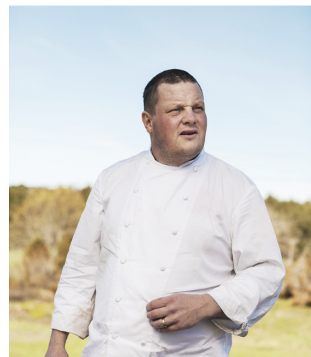
Mikael Björklund.