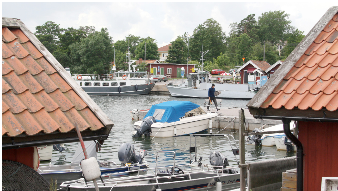
Räfsnäs hamn, en av replipunkterna i vårt område.