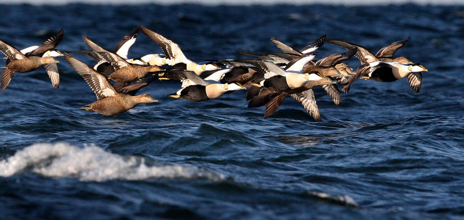
Ejder på flykt.