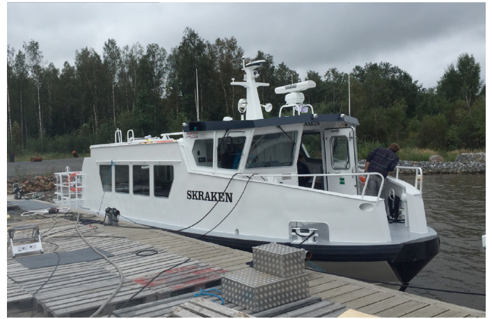
Skraken vid kaj på varvet i Karleby. Foto: Joel Nordstedt.

Vi passerar Ritgrunds fyr i gropig sjö. Foto: Joel Nordstedt.