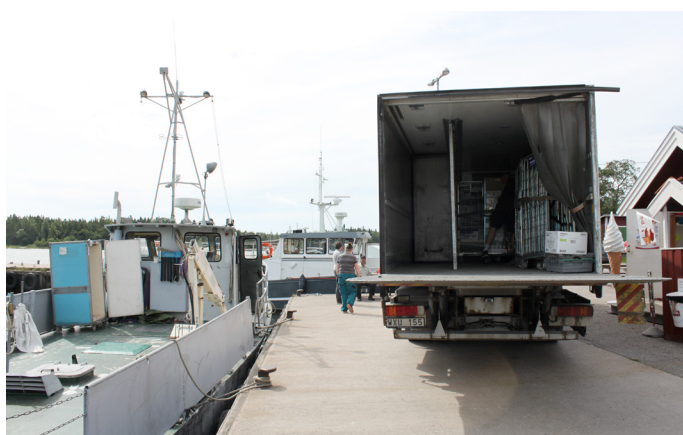
Än får passagerare och lastbilar trängas i hamnen.