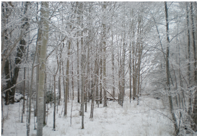
Det är inte all skog som är lönsam.