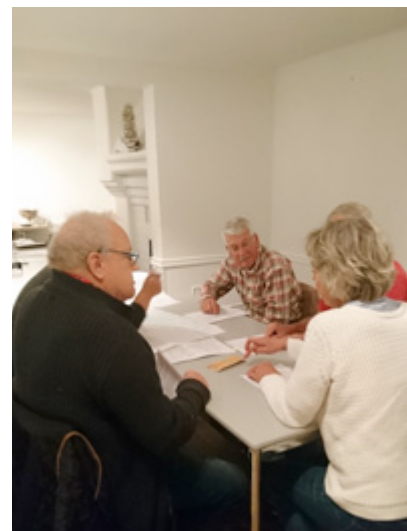
Diskussionerna skedde både vid borden ...

Företagarcentrum bör utvecklas och erbjuda kurser för företagare