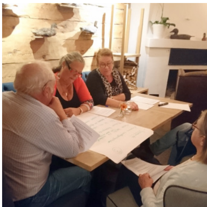
... och mer avslappat i soffgrupperna.

Post- och pakethantering: Påverkan, även från kommunalt håll är ett måste