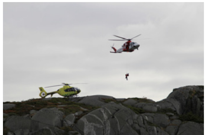
Helikoptersyn är ovärderligt för spaning efter nödställda.