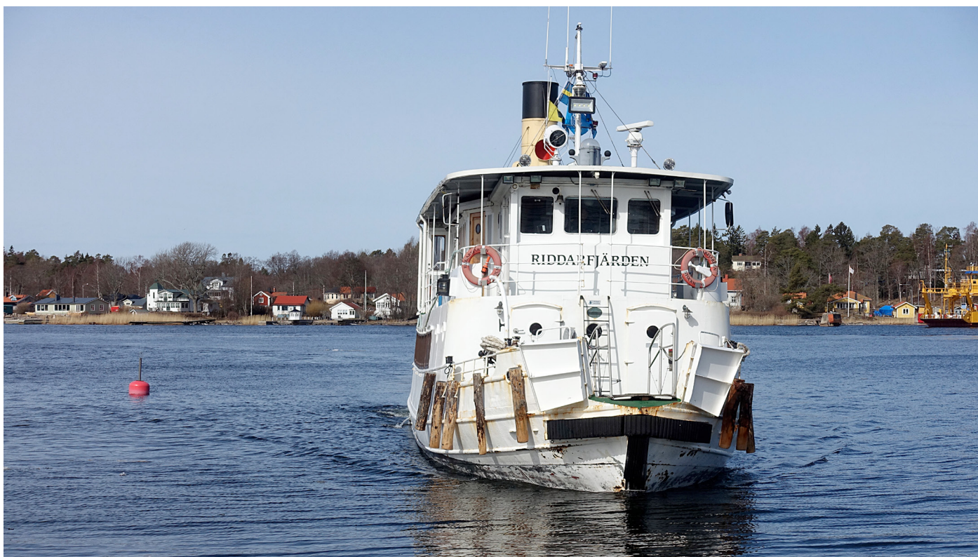
M/s Riddarfjärden anländer till Köpmanholm.