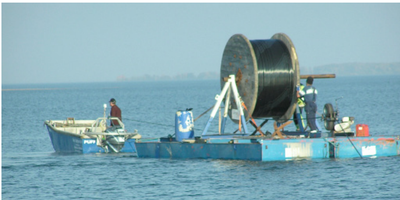
Det går åt många meter kabel när öarna får fiber.