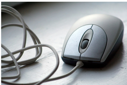
Fjärrundervisning kan var praktiskt i små skolor.

Utbildning på distans kan vara en del i mer bärkraftig och fungerande skola i skärgården. Vi ser