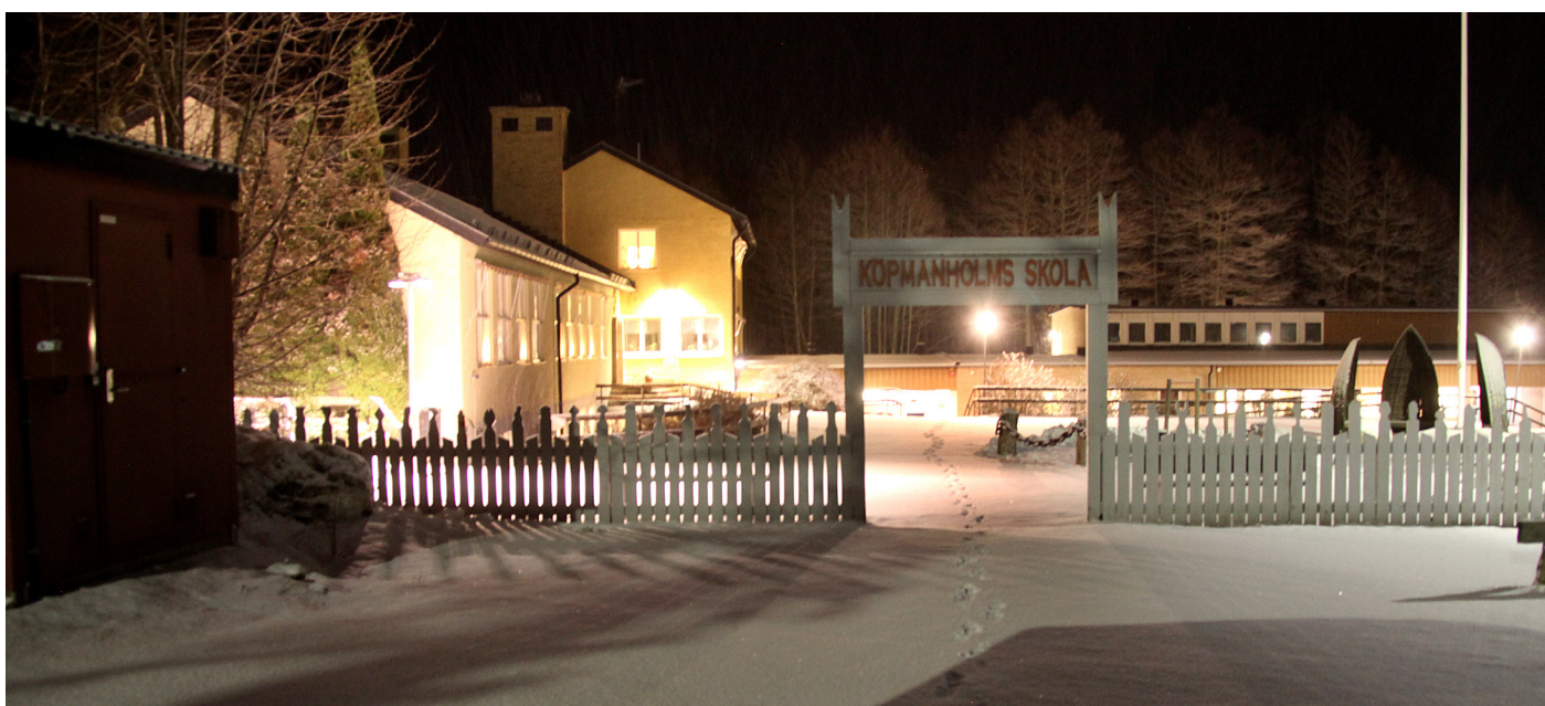
Köpmanholms skola.

Vi sätter skolan först. Många skärgårdsskolor brottas med ett litet elevunderlag och föräldrar med att få ihop skoltransporterna och det egna arbetslivet. Skolskjuts eller rätt till ersättning för egenskjuts ska därför gälla för både skola och fritids. Det ska också vara möjligt att söka förskola och grundskola fritt över kommungränserna, en möjlighet som finns idag när det gäller gymnasiesko-