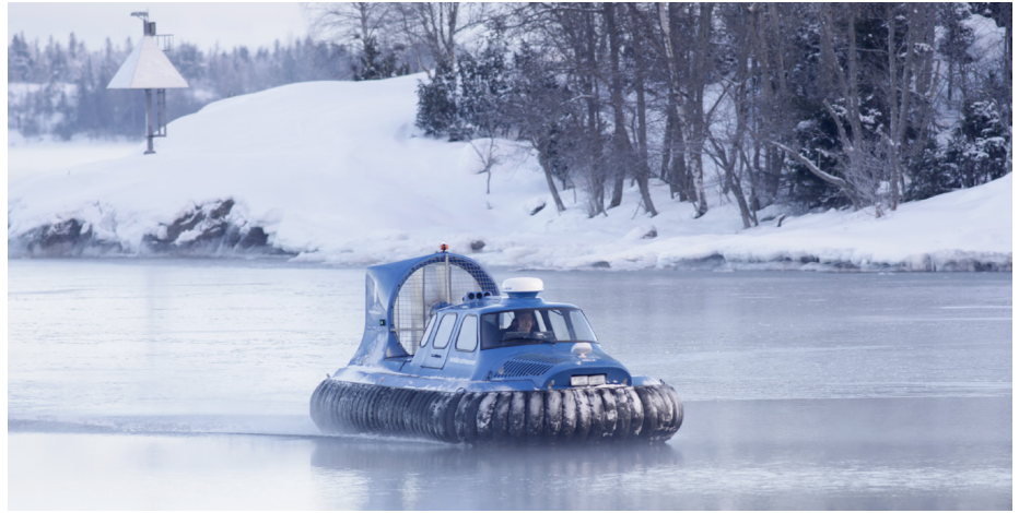
Tack vara svävaren går det att komma fram oavsett isläge.

De förskolor och skolor som finns ska ha bra kvalitet med behöriga lärare så att barnfamiljer känner sig trygga. MP stöder att det ska vara möjligt att utöka och utveckla befintlig samlad bebyggelse som anges i översiktsplanen i skärgårdsområden och inte minst viktigt på kommunens utpekade kärnöar (Arholma, Tjockö och inom kort Gräskö.) Vi vill också stödja