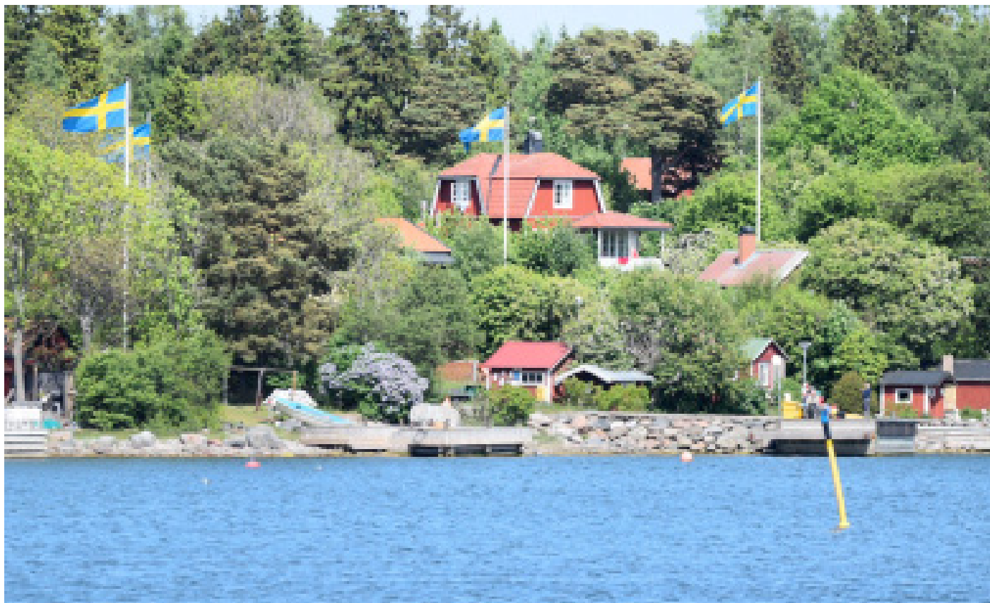
Att få fler att flytta ut till skärgården verkar alla vara överens om, men att få bygga nära vattnet är synnerligen komplicerat.

Vi är det enda lokala parti som kommer att se till att alla medborgares förslag kommer in till kommunen. Vi omvandlar era förslag till motioner. Vi kommer att återkoppla så ni blir uppdaterade hur det går med era förslag.