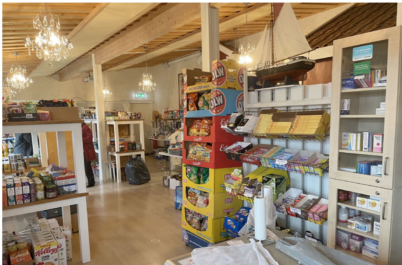
Staplade krogbord och kristallkronor i taket – så blev Ökrogen tillfälligt Öbutik.