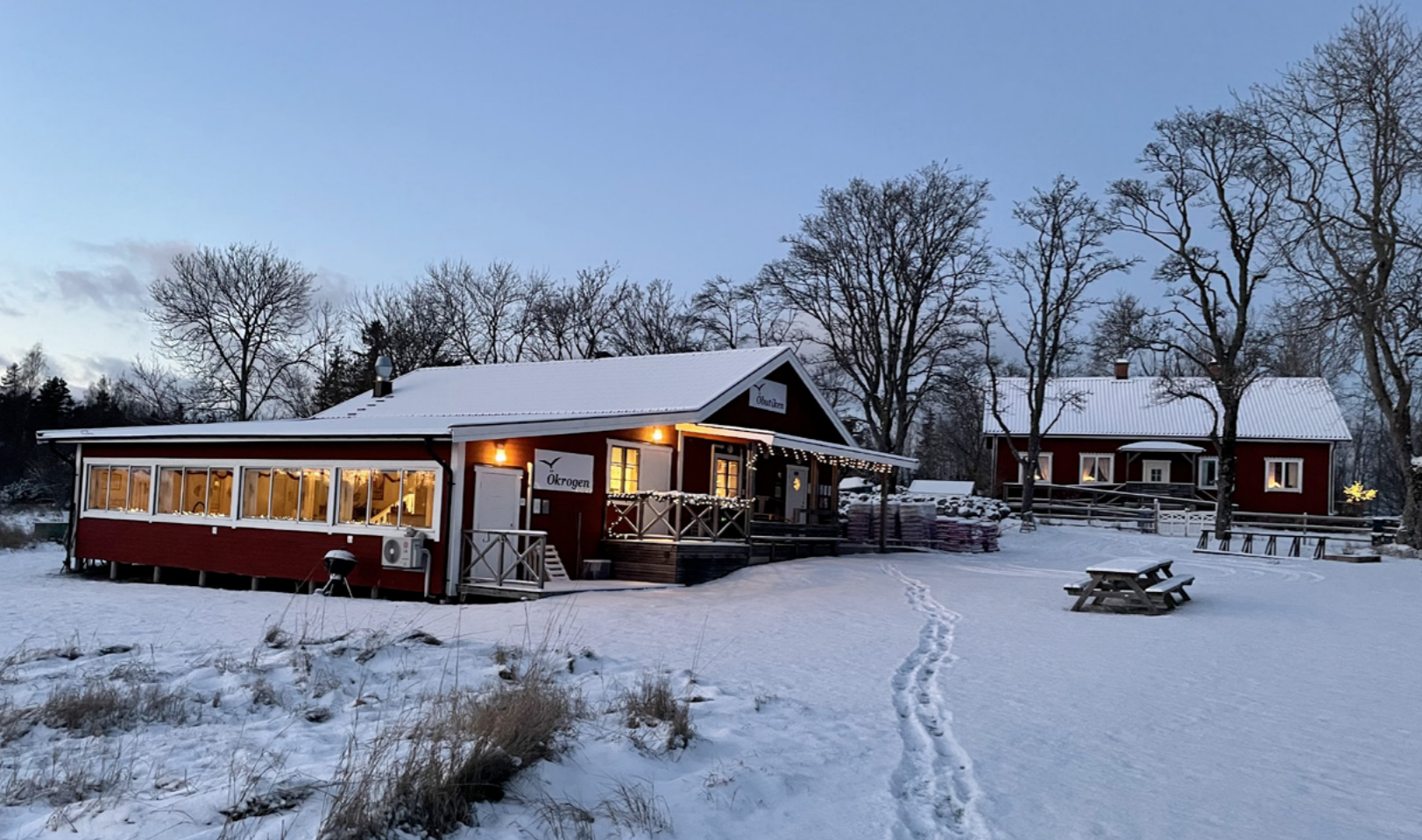
Mitt i byn på Tjockö ligger Ökrogen granne med butiken och tvärs över vägen ligger den gamla skolan som nu är en samlingslokal.