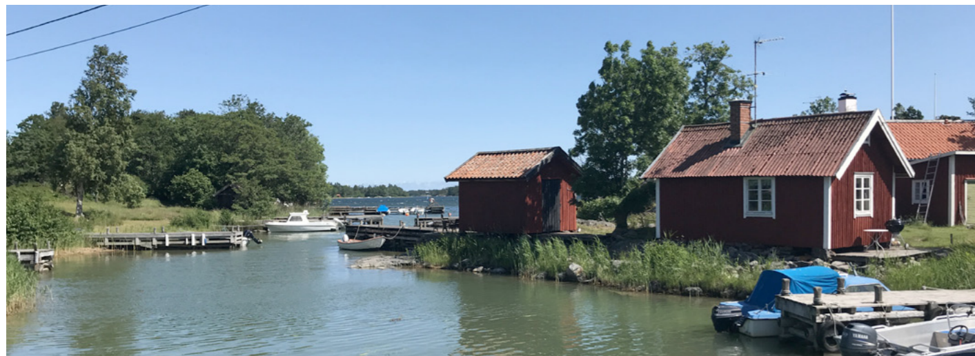
Och i Hela Sverige ingår även skärgården, något som ofta glöms bort.

Texten har tidigare publicerats i tidningen Land 2023 och återges med upphovsrättsinnehavarens samtycke".