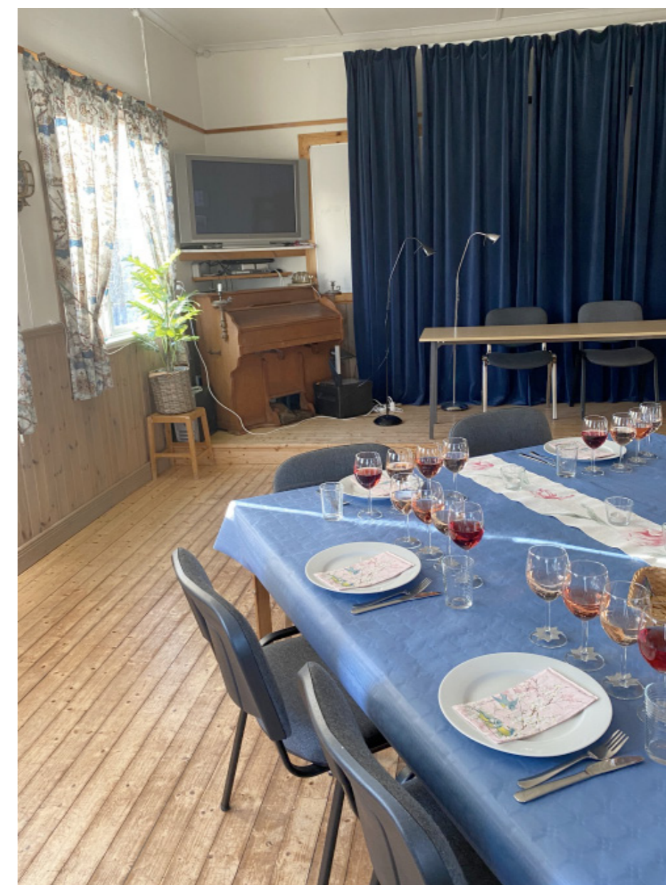
I den gamla skolsalen står orgeln fortfarande kvar och bakom draperiet döljer sig ’svarta tavlan’. Här är lokalen dukat för öns vinprovare.