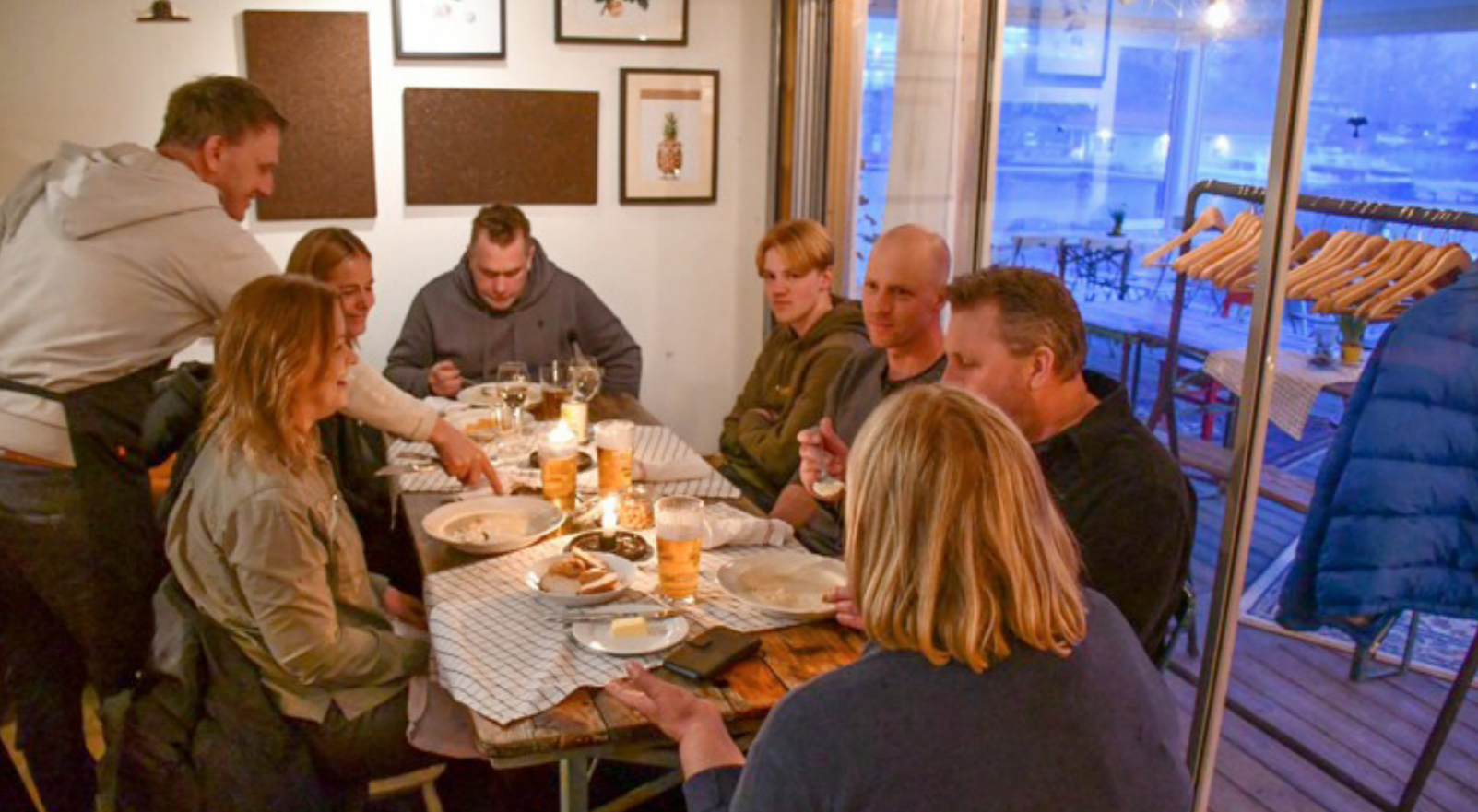
Öbor från Furusund, Yxlan och Gräskö serveras blomkålssoppa med räkor på Furusunds Hamnkrog.