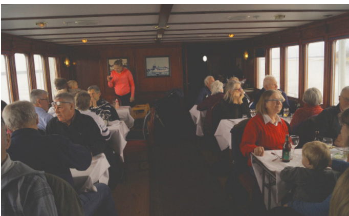
Läcker silltallrik, goda vänner och en vacker utsikt, vad mer kan man begära av en marsdag?

MEDLEMSBLADET ges ut av Blidö-Frötuna Skärgårdsförening.