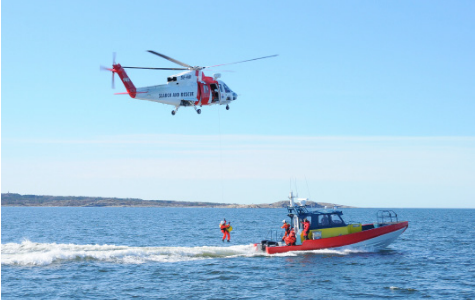
Det är inte alltid det är så här fint väder när Sjöräddningen rycker ut.