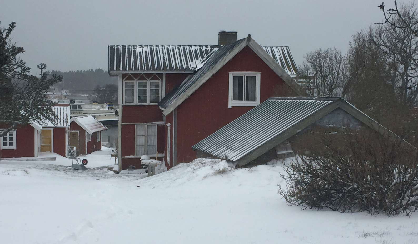
Den gamla släktgården i vintervila.