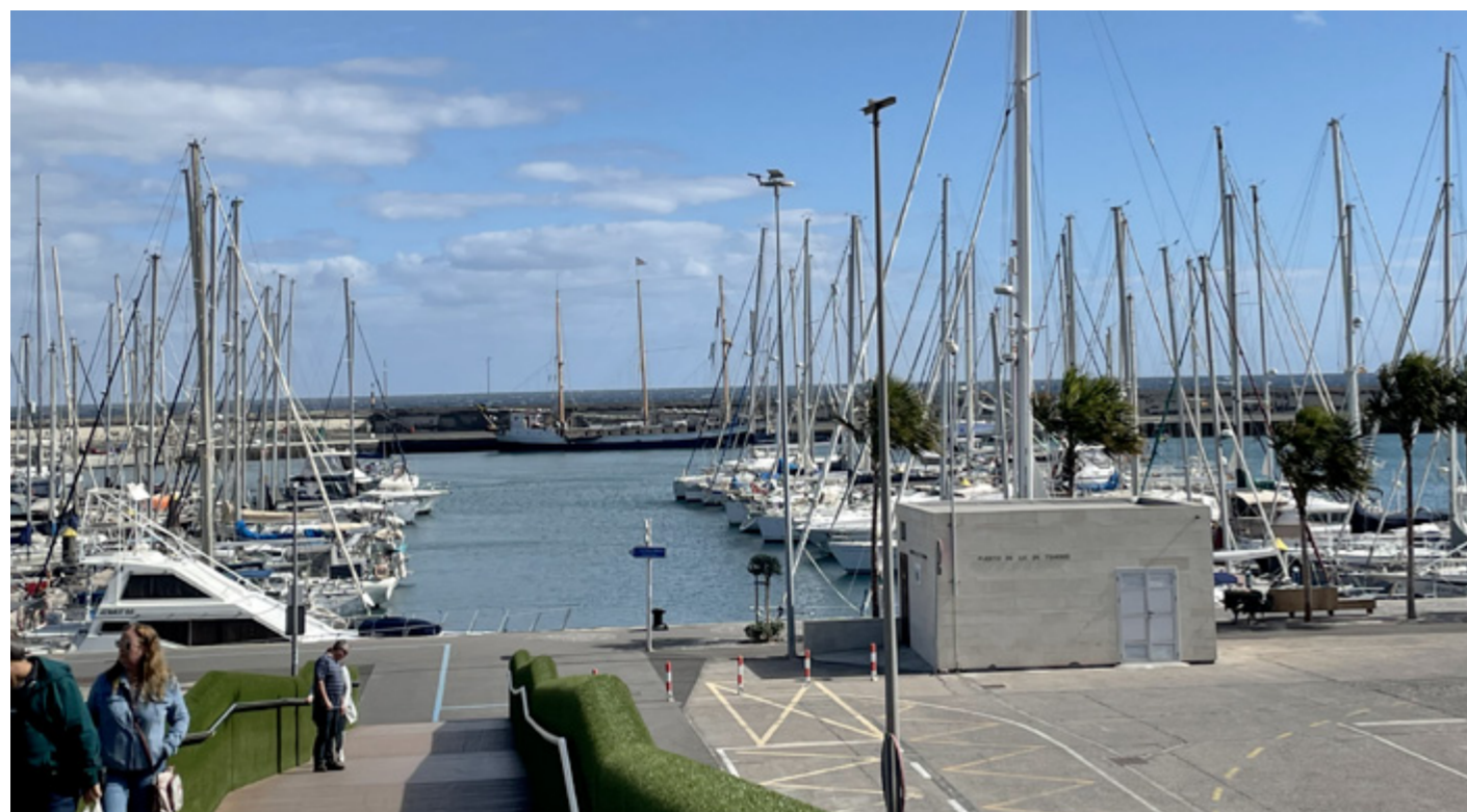
Älva till kaj Marina Santa Cruz på Teneriffa.

Från vår kajplats ser vi vulkanen, som det fortfarande ryker ur, och på vägen in till hamnen såg vi de 'nya' svarta lavaformationerna efter det senaste utbrottet. Eleverna har skrivit prov i VHF och alla blev godkända. I far-