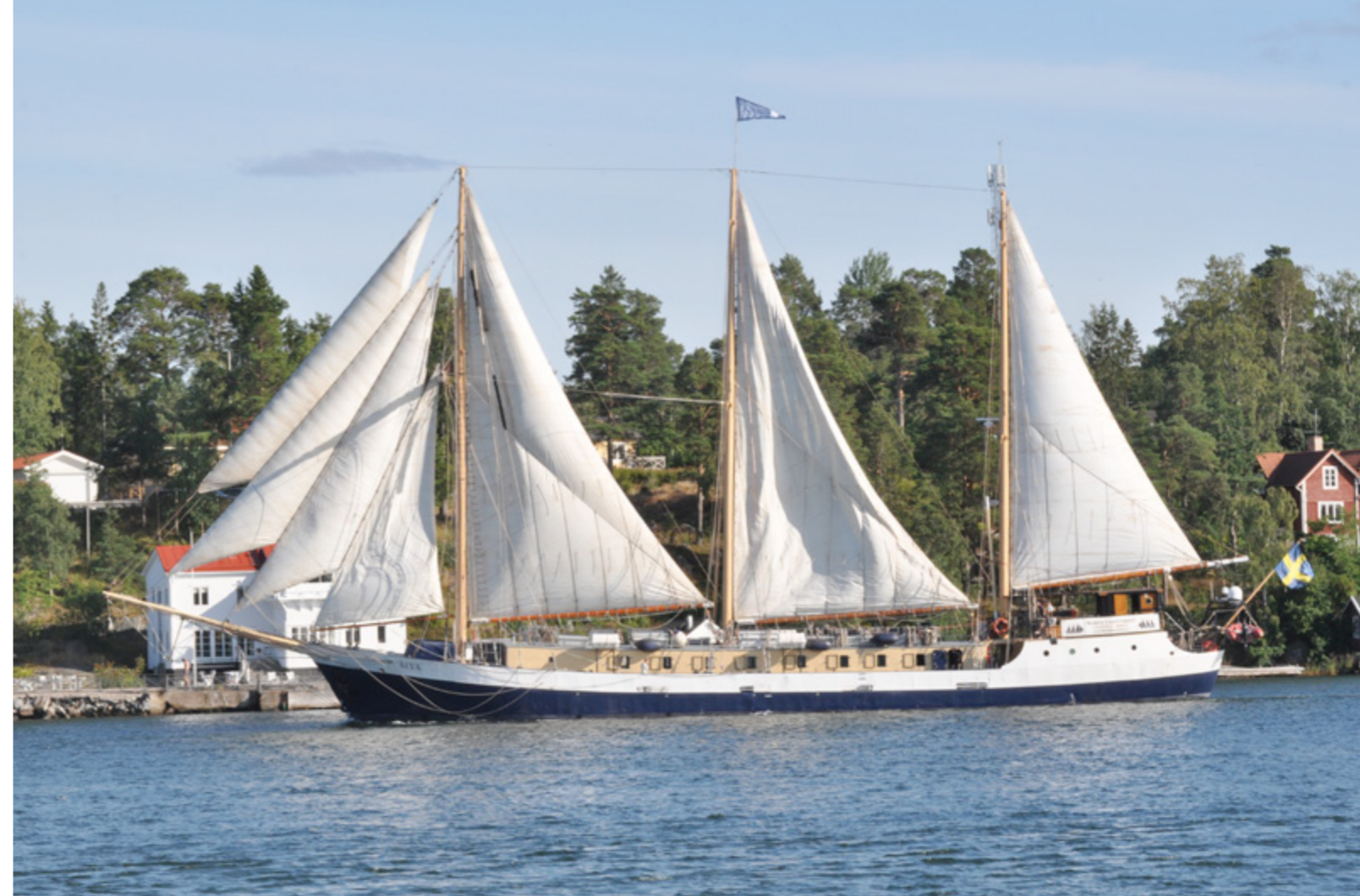
Älva under segel i Furusund.