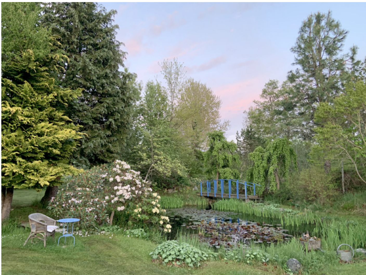
En av de många vackra dammarna i Lassas Hagar.