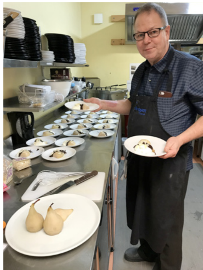
Bodbiträde, ordförande, transportör eller som här, kock på Ökrogen på Tjockö. Det är sällan det blir långtråkigt.