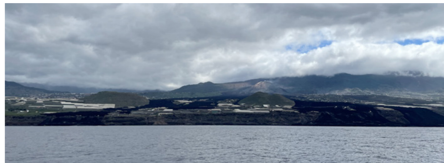
De nya svarta lavastråken på La Palmas västsida och vulkanen som fortfarande ryker.