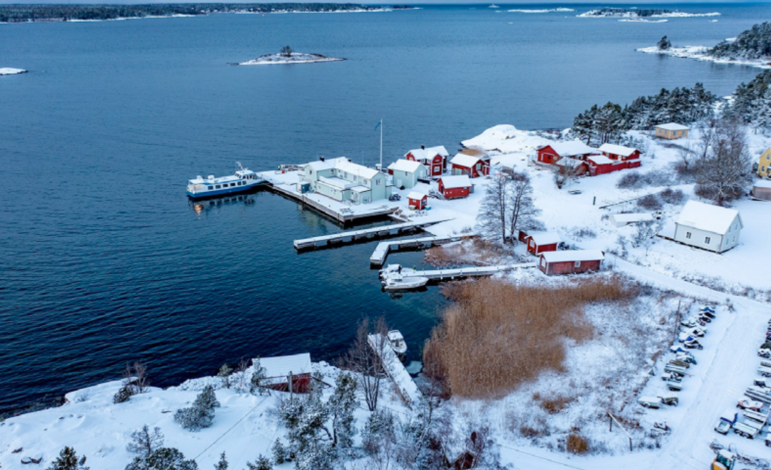
Arholma Handel med butik, bensinpumpar och passbåtsbrygga skulle kunna vara en bra SOT-punkt.