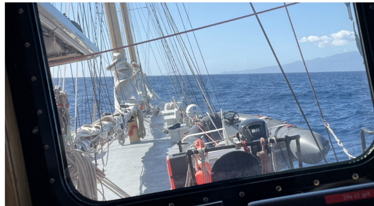
Vågorna försvinner ju tyvärr inte bara för att vinden gör det. Sista biten till El Hierro rullade det en hel del.

tygsbefälskursen har vi därefter gått vidare till att prata skeppsteknik, stabilitet, lagar och regler. De har även bytt marinbiologin mot matematik och läser nu om asymptoter som jag inte har någon aning om vad det är för något, men avancerat är det i alla fall. Nu är det bara en vecka kvar av seglingen och idag kastar vi loss för att, som jag uttryckt det, mys-åka tillbaka till Teneriffa. Det ser inte ut att bli så mycket vind och vi kommer att ha gott om tid att titta på häftiga klippformationer, spana efter valar, göra