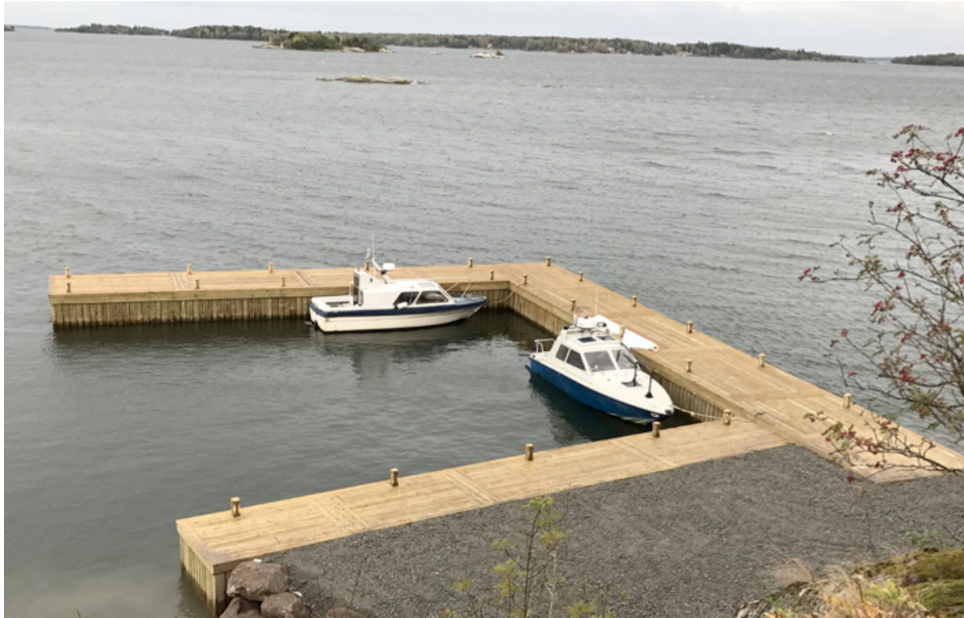
Östernäs brygga var ett välkommet tillskott för öborna när den stod klar 2016.