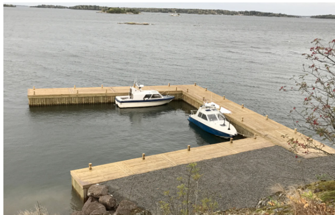
Pendlarparkering för öbor.

Äntligen har de bofasta öborna runt Gräskö en repli-brygga att lägga till vid. Det är på Östernäs, som är det närmaste stället på fastlandet, där bilparkering också finns. Från bryggan finns nu också en gångstig genom skogen till den kommunala bilparkeringen. Ingen har sin bestämda båtplats, men för att lägga till vid bryggan ska man vara medlem i en bryggförening. Den är endast till för fastboende på Gräskö och närliggande öar, och ska sköta drift och betala för el mm. Norrtälje kommun har bekostat bryggan, som, på grund av juridiskt krångel om placeringen, har tagit många år att få till stånd. Men nu ligger den där och öborna runt Gräskö kan stryka ett problem från sina listor.