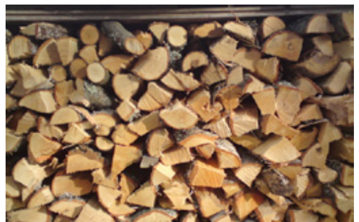
I år är det många välfyllda vedtravar på öarna.