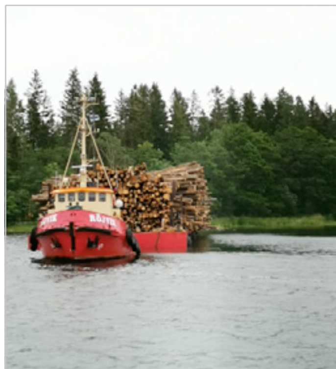
Det här är plockepinn på riktigt!