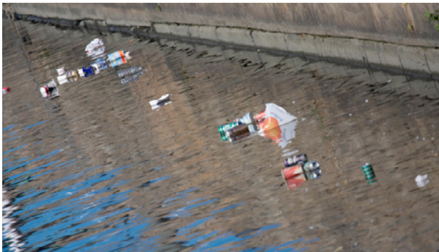
Det är inte det här vattnet är till för.

Miljö & Energigruppen inom Skärgårdarnas Riksförbund