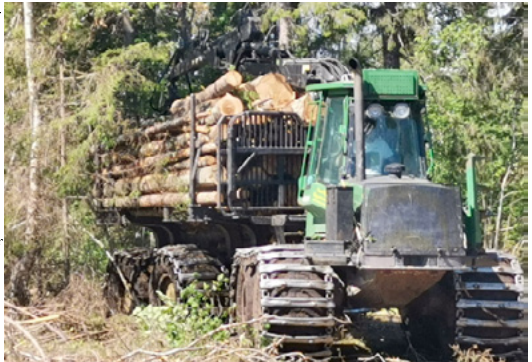
Tack vare frivilliga insatser och hårt arbete kanske Söderöra så sakteliga återtar sitt forna utseende.