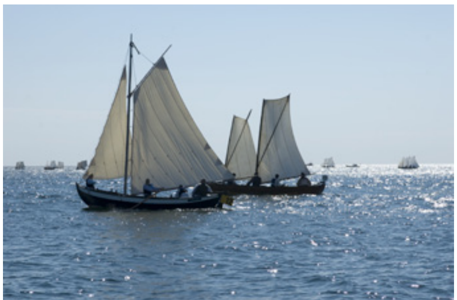
Till Allmogeåtar i Långgarn gick en av medlemsutflykterna under det gångna verksamhetsåret.