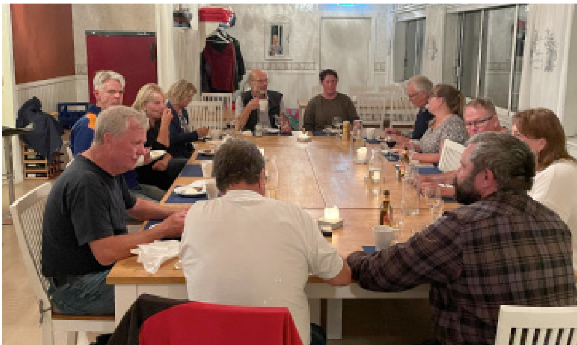
Förra årets enda fysiska möte var på Tjockö i september. Efter mötesförhandlingarna var öborna inbjudna för att prata med styrelsen.

MEDLEMSBLADET ges ut av Blidö-Frötuna Skärgårdsförening, c/o Barbro Nordstedt, Furusunds strandväg 18, 760 19 Furusund • www.bfsf.se • bankgiro: 439-8152 • swish: 1231658541 MEDLEMSBLADET trycks hos Sollentuna Offset & Digitaltryck AB. Redaktion: Malin Lenke, Anna Vogel och Tove Svensson Vill du komma i kontakt med styrelsen eller redaktionen – gå in på hemsidan, www.bfsf.se Layout: Renée Eklind, renee.eklund@gmail.com , tfn 0708 20 45 55 Omslagsbild: Norrskan över Furusund.