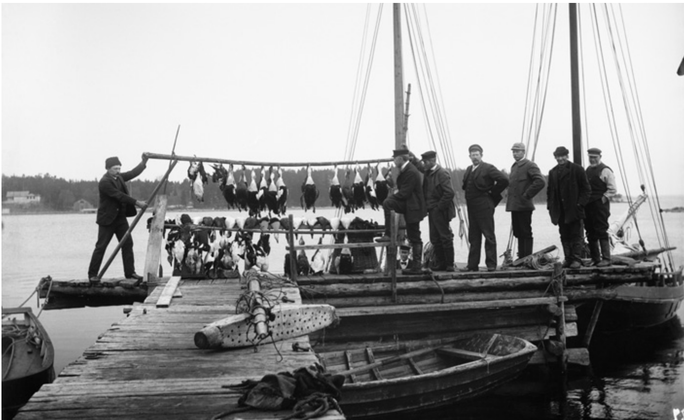
Stolta skyttar visar upp sin fångst av ejder på en brygga i Köpmanholm.