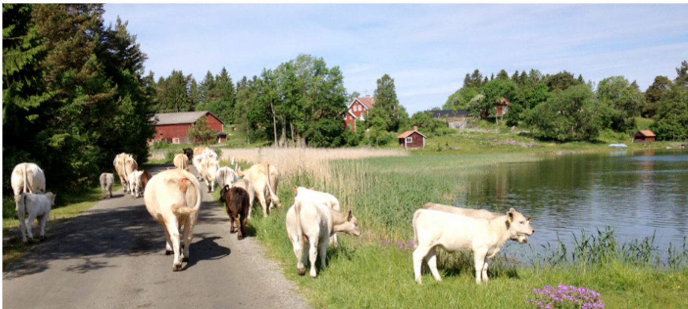
Undrar om de märker ifall vi tar oss ett dopp innan vi går hem?